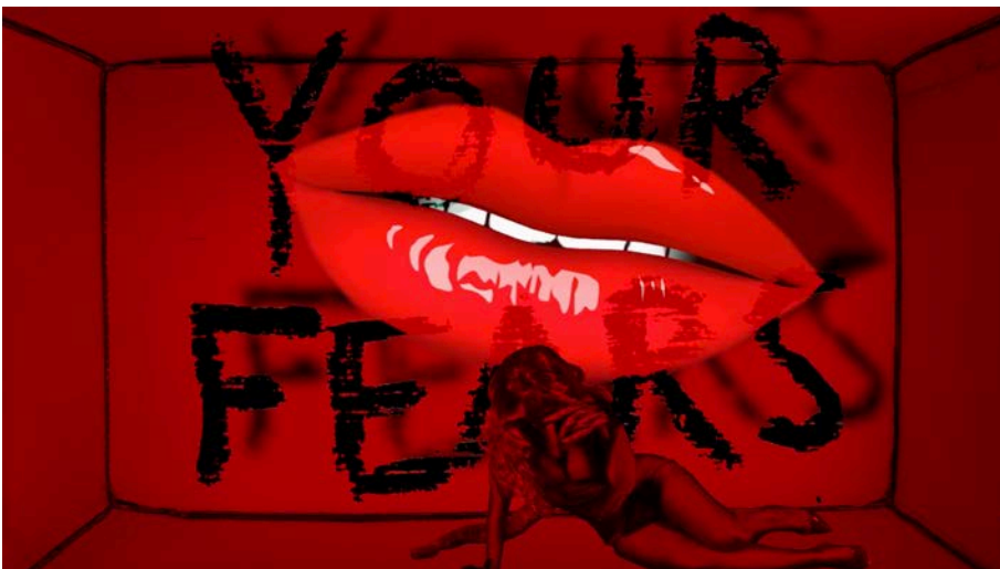
Puck Verkade Cursed, 2020 Looped video, sound 5:00 minutes

«Dreispitz, starkes Wildkraut wächst aus den kleinsten Rissen im Betonpflaster, überquert die Bahngleise wie Narben, die von vergangenen Zeiten künden und daran erinnern, dass alle Geschichte aktuell ist.» (Puck Verkade, Dreispitz-Aufenthalt im Februar 2020)